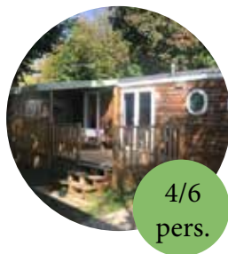
Mobile home O'hara 784