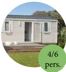
Mobile home Super Mercure